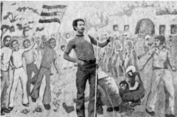
EL ONCE DE MARZO, MURAL DE MYRNA RODRÍGUEZ

(4) Todo lo positivo que hubo en la carrera patriótica de Albizu Campos puede reducirse a una sola formulación: identificar al enemigo de su pueblo. A un pueblo abandonado a la desorientación desde 1898 Albizu le señala a su enemigo: el imperialismo yanqui. El acto bélico de las FALN, siguiendo ese camino pero actuando en tiempo diferente, señala al pueblo de Puerto Rico y a la